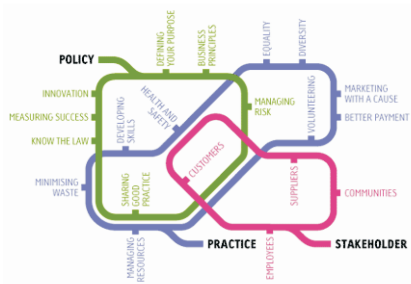
Kuva 2. Kehittämisen prosessin vaiheet. 74

Lähtökohtana on, miten yritys voi lisätä kilpailukykyään ekologisten ja sosiaalisten vastuiden paremmalla hallinnalla.